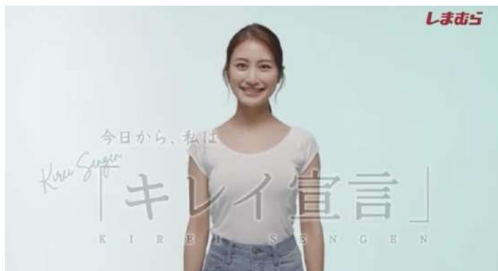
ファッションセンターしまむら「菌とニオイにWで働く、しまむらのWデオドラントインナー キレイ宣言」