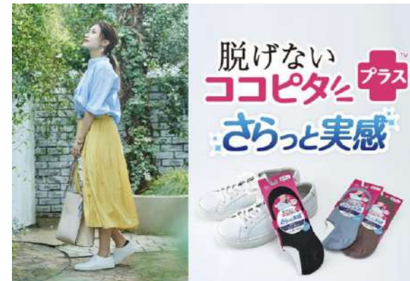
靴下の岡本「脱げないココピタ さらっと実感」