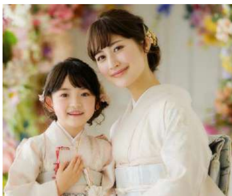
「らかんスタジオ 七五三」