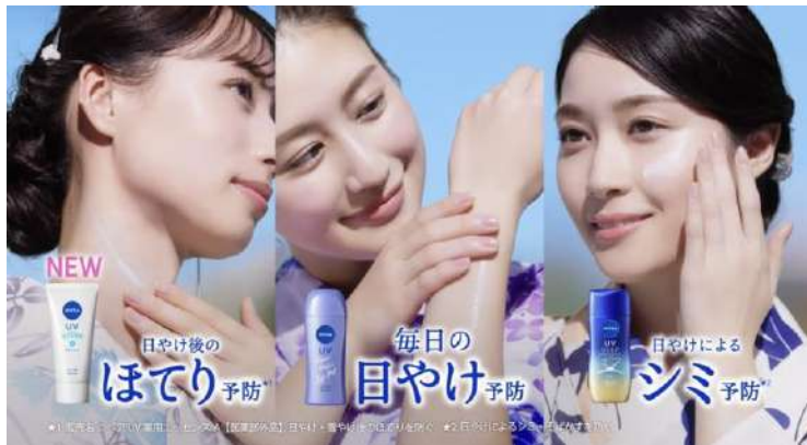
ニベア花王「ニベアUV ニベアUV3シリーズ」