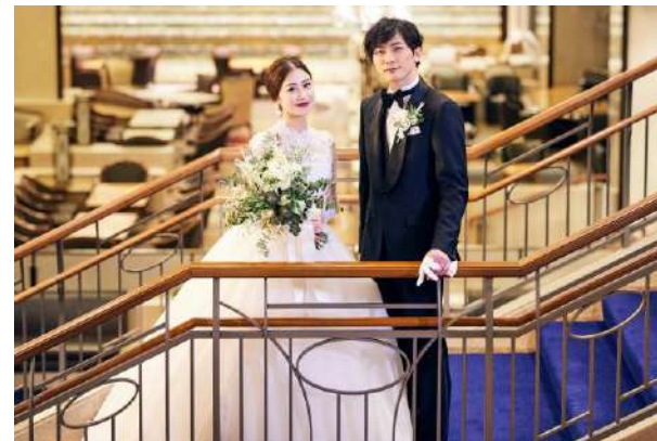
リクルート「ゼクシィ」